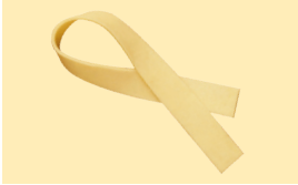
Hausmacher Eiernudeln Walznudeln 8 mm