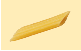
Hausmacher Eiernudeln Röhren