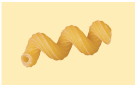
Hausmacher Eiernudeln Drelli